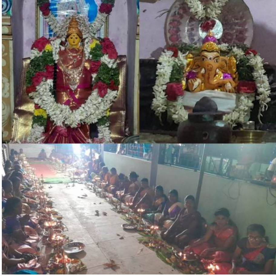
புதுக்கோட்டை, மார்ச் 7-

புதுக்கோட்டை மாவட்டம் ஆலங்குடி அருகே உள்ள பாத்தம்பட்டி கிராமத்தில் அமைந்திருக்கும் ஸ்ரீ ராஜகணபதி ஆலயத்தின் ஐந்தாம் ஆண்டு வருடாபிஷேகம் நடைபெற்றது. அதனைத்