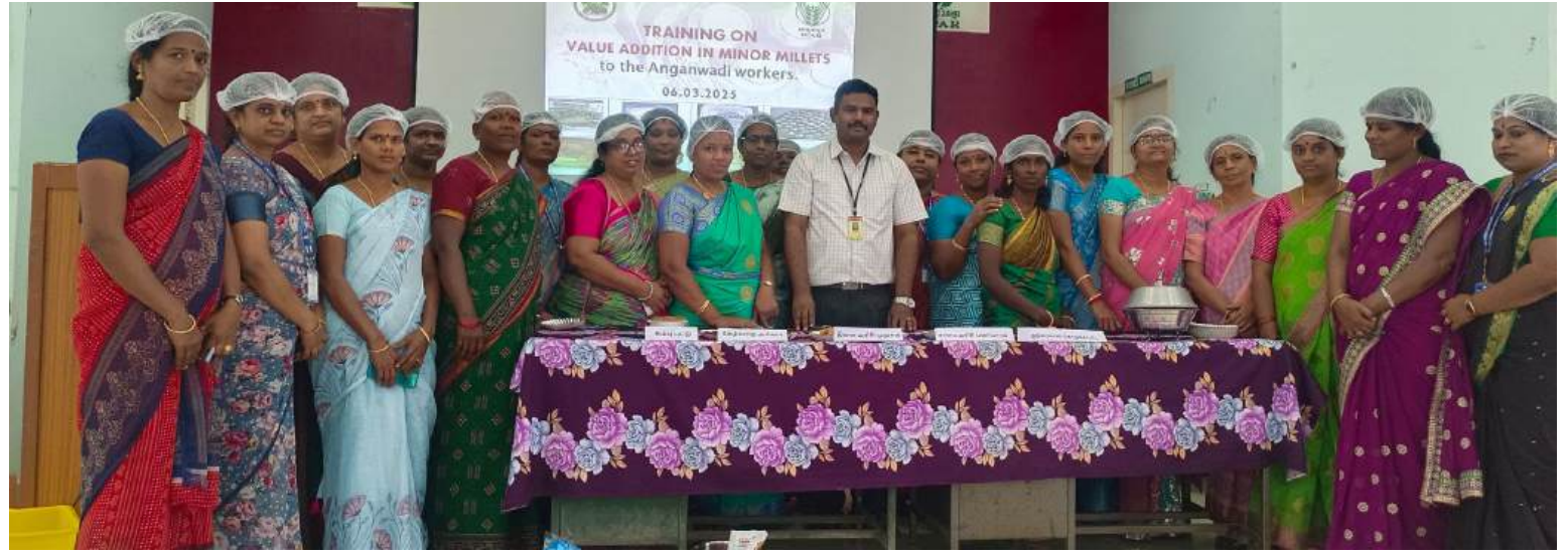
காரைக்கால், மார்ச் 7-

காரைக்கால் அறிவியல் நிலையத்தில், சிறுதானியங்களை மதிப்புக்கூட்டுதல் குறித்து சிறப்பு பயிற்ச்சி முகாம் நேற்று சிறப்பாக நடைபெற்றது.