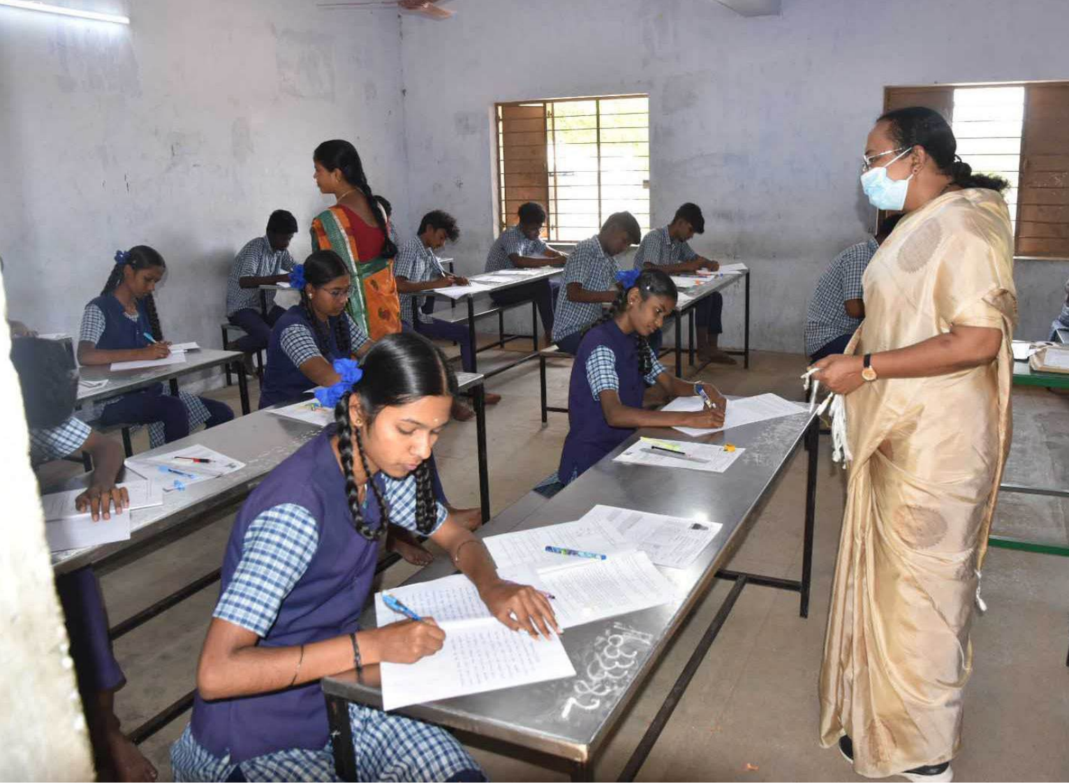
வேலூர் மாவட்டம், காட்பாடி வட்டம், சேக்காடு அரசு மேல்நிலைப்பள்ளியில் நடைபெற்று வரும் 12 ஆம் வகுப்பு (ஆங்கிலம் பாடம்) பொதுத்தேர்வு மையத்தை மாவட்ட ஆட்சித்தலைவர் வே. இரா.சுப்புலெட்சுமி பார்வையிட்டு ஆய்வு செய்தார்.