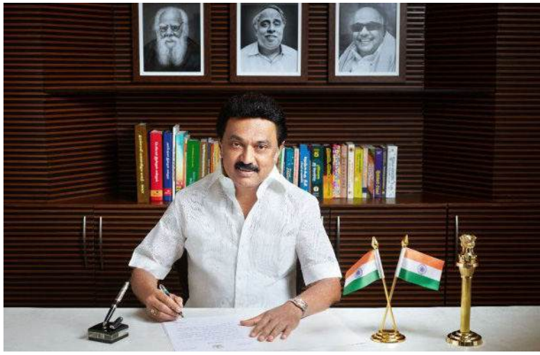
வேலூர், மார்ச் 3-

வேலூர் மாவட்ட பயனாளிகள் நெஞ்சார்ந்த நன்றி