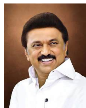
விழுப்புரம், மார்ச் 3-

தமிழ்நாடு முதலமைச்சர், தமிழ்நாட்டின் பொருளாதார வளர்ச்சிக்கும், பொதுமக்களின் வாழ்வாதார மேம்பாட்டிற்கும் பல்வேறு சிறப்புத் திட்டங்களை தொடர்ந்து செயல்படுத்தி வருகிறார். இதன் மன்றொரு வரலாற்று சிறப்பு நிகழ்வாக, அனைவருக்கும் குறைந்த விலையில் பொதுப்பெயர் (ஜெனரிக் மருந்துகள் மற்றும் பிற மருந்துகள்) கிடைக்கப்பட்டு வேண்டும் என்ற உயர்ந்த நோக்கத்தில், 15.08.2024 அன்று நடைபெற்ற சுதந்திர தினவிழாவில், தமிழ்நாடு முழுவதும் முதற்கட்டமாக 1000 முதல்வர் மருந்தகங்கள் திறக்கப்படும் என அறிவிப்பினை வெளியிட்டார்கள்.