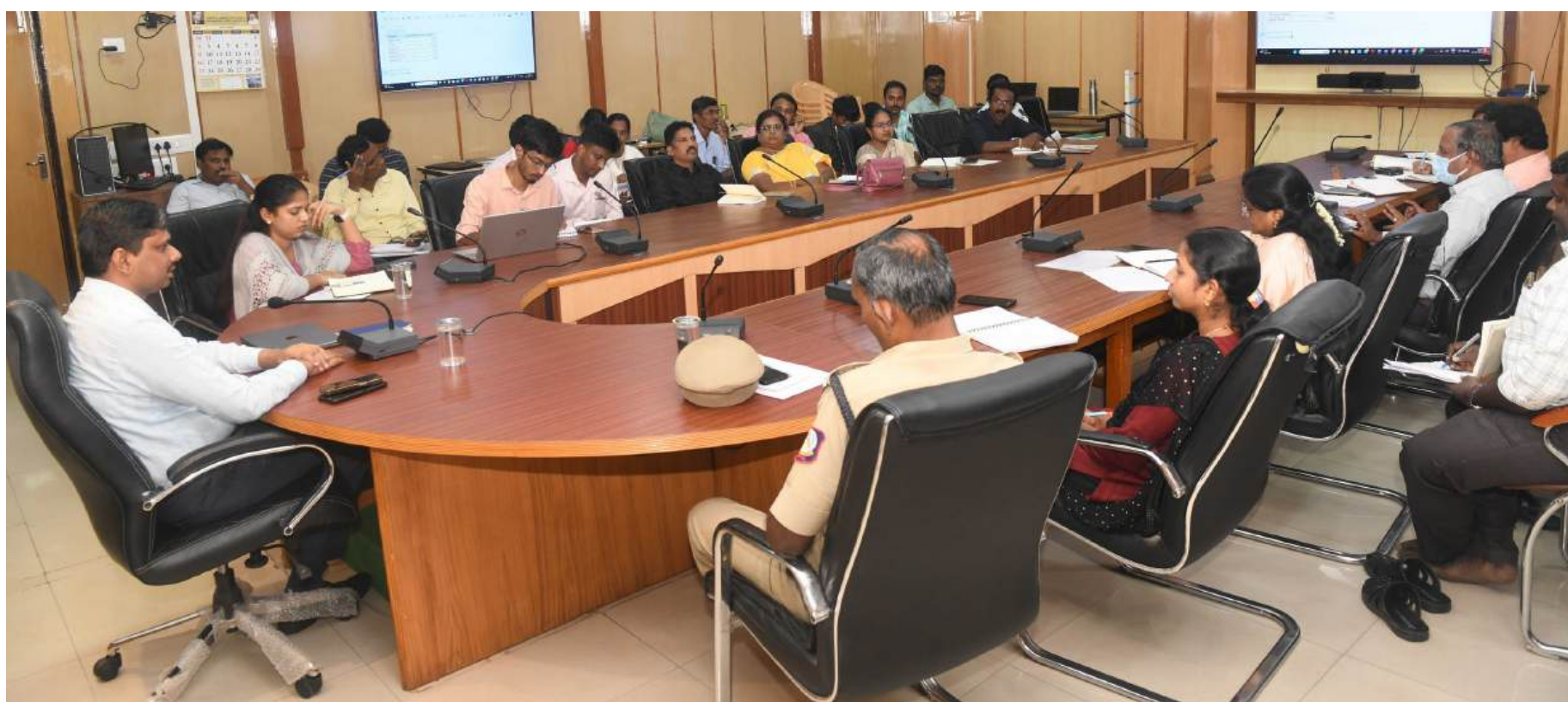
தூத்துக்குடி மாவட்ட ஆட்சியர் அலுவலகக் கூட்டரங்கில் சமூகப் பொறுப்பு நிதியின் கீழ் தூத்துக்குடி மாவட்டத்தில் மேற்கொள்ளப்படவிருக்கும் பணிகள் குறித்து அரசு அலுவலர்களுடனான ஆய்வுக் கூட்டம் மாவட்ட ஆட்சித்தலைவர் இளம்பகவத் தலைமையில் நடைபெற்றது.