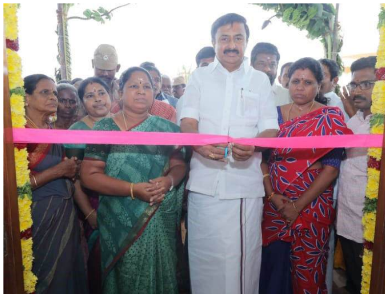
தமிழ் வளர்ச்சி மற்றும் செய்தித்திறை அமைச்சர் சாபிநாதன் மற்றும் மனித வள மேலாண்மைத்துறை அமைச்சர் என்.கயல்விழி செல்வராஜ் ஆகியோர் திருப்பூர் மாவட்டம், தாராபுரம் ஊராட்சி ஒன்றியம், கவுண்டர்ச்சிபுதூர் ஊராட்சி, கொண்டர்ச்சிபாளையத்தில் சமுதாய நலக்கூடத்தை திறந்து வைத்தார்கள்.