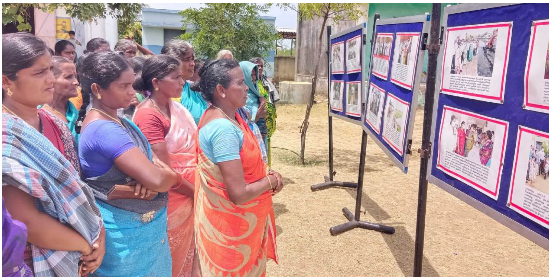
தூத்துக்குடி மாவட்டம் சாத்தான்குளம் ஊராட்சி ஒன்றியம் பண்டாரபுரம் கிராமத்தில் தமிழக அரசின் சாதனைகள் மற்றும் சிறப்புத் திட்டங்கள் குறித்து செய்தி மக்கள் தொடர்புத்துறையின் சார்பில் வைக்கப்பட்டிருந்த புகைப்படக்கண்காட்சியினை பொதுமக்கள் பார்வையிட்டனர்.