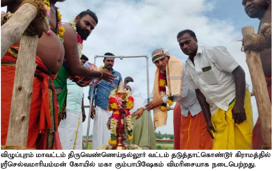
விழுப்புரம் மாவட்டம் திருவெண்ணையநல்லூர் வட்டம் தடுத்தாட்கொண்டு கிராமத்தில் ஸ்ரீசெல்வமாரியம்மன் கோயில் மகா கும்பாபிஷேகம் விமரிசையாக நடைபெற்றது.