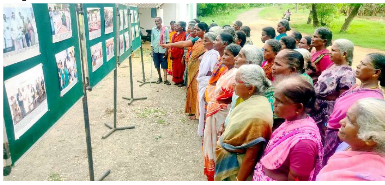
ஈரோடு ஊராட்சி ஒன்றியம் கதிரம்பட்டி ஊராட்சியில் செய்தி மக்கள் தொடர்புத்துறையின் சார்பில் அமைக்கப்பட்ட தமிழ்நாடு அரசின் திட்டங்கள் மற்றும் சாதனைகள் குறித்த புகைப்படக் கண்காட்சியினை பொதுமக்கள் பார்வையிட்டனர்.