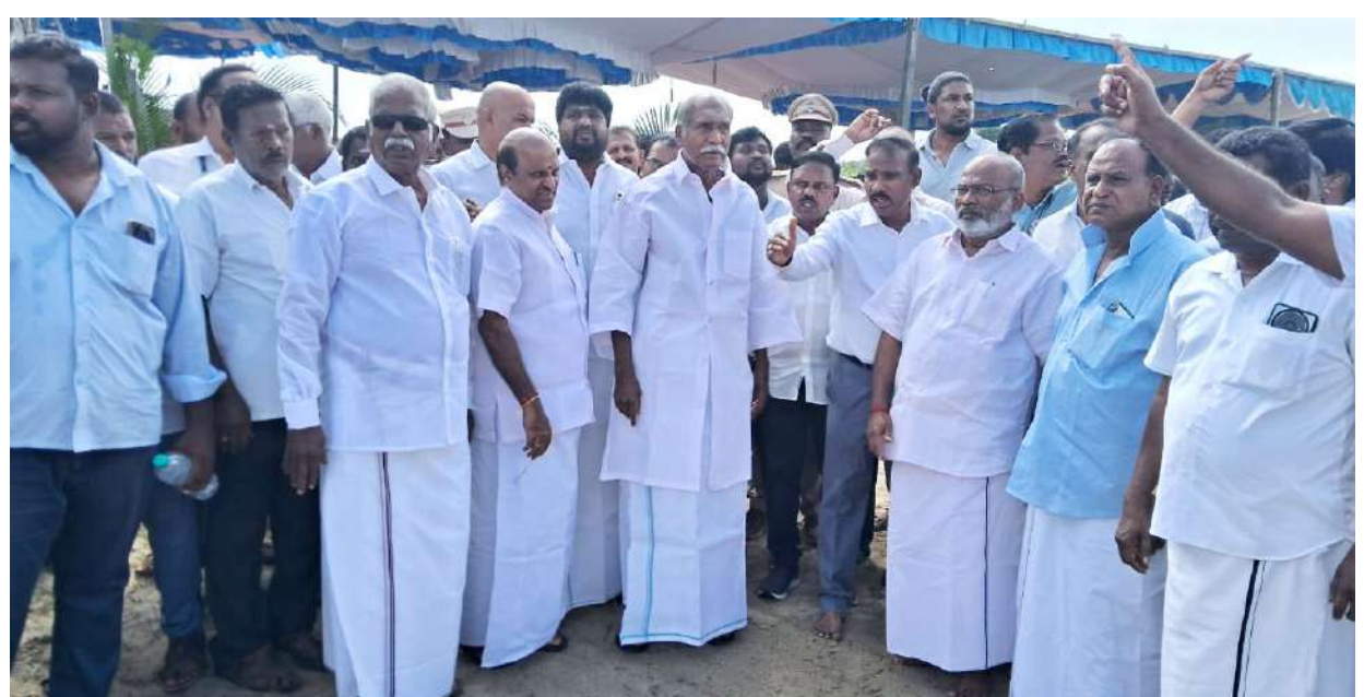
புதுச்சேரி, நவ. 5- புதுச்சேரி வீரம்பட்டினத்தில் 46.16 கோடி ரூபாய் மதிப்பில், மீன்பிடி துறைமுகம் கட்டுமானம் மற்றும் விரிவாக்க பணியை முதலமைச்சர் ரங்கசாமி அடிக்கல் நாட்டி துவக்கி வைத்தார். அரியாங்குப்பம் தொகுதி சாமிநாத நாயக்கர் விதி, சுப்புராய பிள்ளை விதி, புரணாங்குப்பம் விதி உள்ளிட்ட இடங்களில் சாலையை மேம்படுத்த, பொதுப்பணித்துறை மூலம் ரூ. 2.60 கோடிக்கான பணியை முதலமைச்சர் ரங்கசாமி நேற்று துவக்கி வைத்தார். இந்த நிகழ்ச்சியை தொடர்ந்து, பொதுப்பணித்துறை கட்டிடங்கள் மற்றும் சாலை (தெற்கு)கோட்டத்தின் மூலம், வீரம்பட்டினம் மீன்வகி ராமம், தேங்காய்திட்டு, (அரிக்கன்மேடு) பகுதியில், மத்திய அரசு நிதி வழங்கும் திட்டம் (சி.எஸ்.எஸ்.) பிரதமரின் மீன்வள மேம்பாட்டு திட்டத்தின் கீழ், 53.38 கோடி ரூபாய் அனுமதி பெறப்பட்டு 46.16 கோடியில் மீன்பிடி துறைமுகம் கட்டுமானம் மற்றும் விரிவாக்க பணியை முதலமைச்சர் ரங்கசாமி அடிக்கல் நாட்டினார். நிகழ்ச்சியில் பொதுப்பணித்துறை அமைச்சர் லட்சுமி நாராயணன், பாஸ்கர் எம்.எல்.ஏ., ஆகியோர் முன்னிலைவகித்தனர். பொதுப்பணித்துறை தலைமை பொறியாளர் தீனையாளன், கண்காணிப்பு பொறியாளர் வீரசெல்வம், செயற்பொறியாளர் சந்திரகுமார், பாலசுப்ரமணியன், உதவி பொறியாளர் கோபி, இன்ஜினிয়ার் பொறியாளர் பிரபாகர் உட்பட என்.ஆர்., காங்கிரஸ் நிர்வாகிகள், வீரம்பட்டினம் பஞ்சாயத்து, முக்கியஸ்தர்கள், பொதுமக்கள் பலர் கலந்துகொண்டனர்.