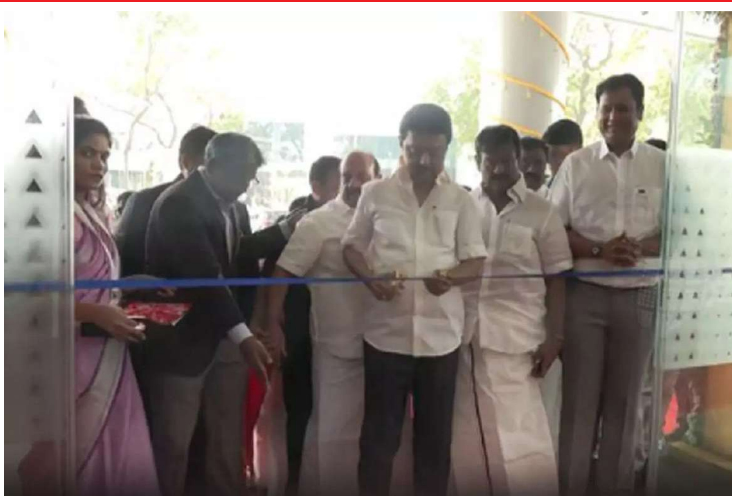
வதன் மூலம் தமிழ்நாட்டின் திருவள்ளூர் உள்ளிட்ட உள்ள படித்த இளைஞர்கள் மாவட்டங்களின் சமூக வடபகுதியைச் சார்ந்த குறிப்பாக சுற்றுலா மாவட்டங்களில் வேலைவாய்ப்பு பெறுவதுடன் அந்த பொருளாதார நிலையம் மேம்படும்.

சென்னை, நவ. 22- தமிழ்நாட்டின் வடபகுதியில் உள்ள நகரங்களுக்கு தகவல் தொழில்நுட்ப வளர்ச்சியை கொண்டு செல்லும் நோக்கத்துடன் திருவள்ளூர் மாவட்டம் பட்டாபிராமில் 11.41 ஏக்கர் பரப்பளவில் ரூ.330 கோடி செலவில் தரை மற்றும் 21 தளங்களுடன் 5.57 லட்சம் சதுரடி பரப்பளவில் டைடல் பூங்கா கட்டப்பட்டு உள்ளது. இதனை முதலமைச்சர் மு.க.ஸ்டாலின் இன்று திறந்து வைத்தார். இக்கட்டிடத்தில் தகவல் தொழில்நுட்ப நிறுவனங்கள் செயல்பட தேவையான, நவீன தொலைத்தொடர்பு வசதிகள், தடையற்ற உயரழுத்த மும்முனை மின் இணைப்பு மற்றும் மின் இயக்கி வசதிகள், மின்தூக்கி வசதிகள், சுகாதார வசதிகள், தீபாதுகாப்பு மற்றும் கட்டிட மேலாண்மை வசதிகள், கண்காணிப்பு கேமரா வசதிகள், 24 மணிநேர பாதுகாப்பு வசதிகள், உணவகம் மற்றும் உடற்பயிற்சி கூடம் போன்ற அனைத்து வசதிகளும் ஏற்படுத்தப்பட்டு உள்ளன. 6 ஆயிரம் தகவல் தொழில் நுட்ப வல்லுனர்கள் பணிபுரியும் வகையிலும் பசுமை கட்டிடம் வழிமுறைகளின்படியும் இக்கட்டிடம் கட்டப்பட்டு உள்ளது. பட்டாபிராமில் இப்புதிய டைடல் பூங்கா அமைக்கப்படு