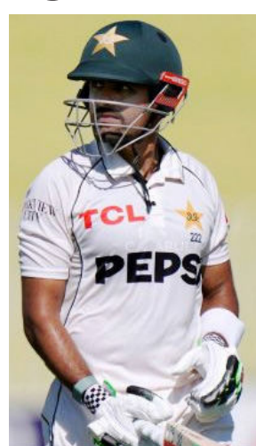
Shan said on the BBC's Stumped podcast.

"I think he's one of the best batsmen in the world. I'm nobody to deny him a future. He has every quality to be one of the greatest batsmen in Test cricket,"